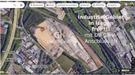
Industrie-Gebiet mit Bahnanschluss.jpg 312K