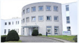
Thalia-Absage_ Droht Hagen der nächste Rückschlag_.jpg 282K