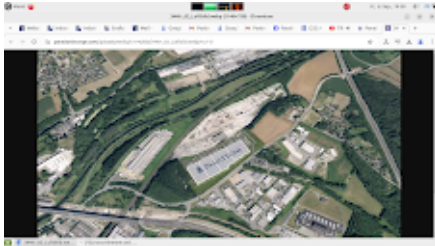
Bildschirmfoto zu 2024-09-06 14-58-05.png 1347K