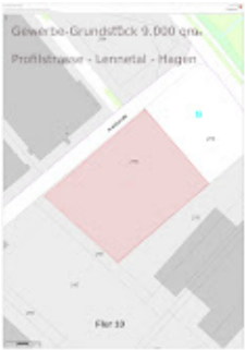
Freies Gewerbe-Grundstück 9.000 qm Profilstraße Hagen.jpg 825K