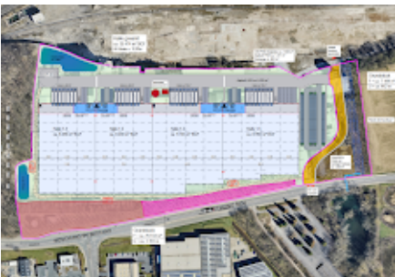
Lageplan Pannatoni- Hagen.PNG 2058K