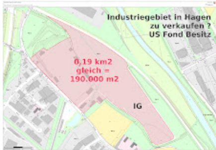
VorschauBild-Dolomit IG 0,19 km2 Baufläche.jpg 2727K