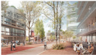
Deutsche Bahn in Hagen_ Die nächste Peinlich-Posse.jpg 298K