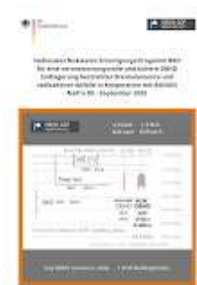
Titelbaltt NaPro DE Sept 2025 Ing. Goebel für BMUKN.jpg 929K