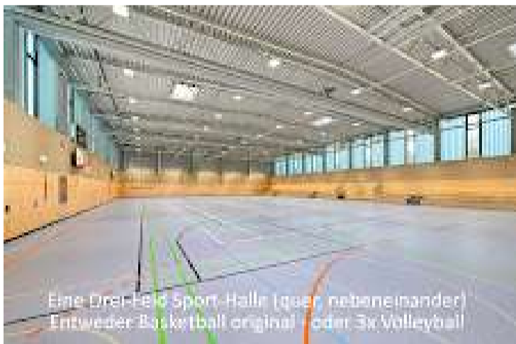
3 Feld Sporthalle.jpg 911K

Ausführungs-Pläne in einem Arch. Büro sehr wahrscheinlich vorhanden