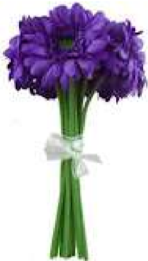
Flowers for you.jpg 8K

Eine Drei-Feld Sport-Halle (ger. nebeneinander) Entweder Basketball original - oder 3x Volleyball