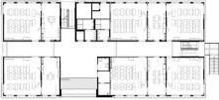
Grundriss Schule Hagen.jpg 388K

Ausführungs-Pläne in einem Arch. Büro sehr wahrscheinlich vorhanden